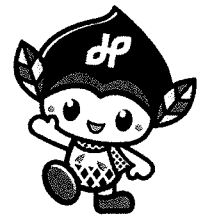
緑区マスコットキャラクター みどりっち