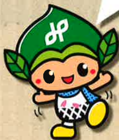
緑区のまちづくり隊長 「みどりっち」