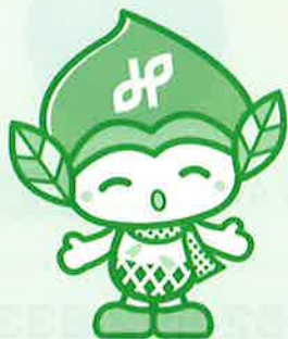
緑区のまちづくり隊長 「みどりっち」